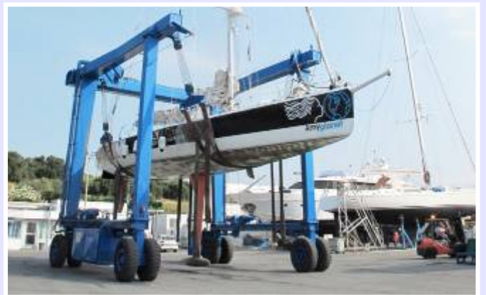
不同的就業機會：遊艇維修及保養