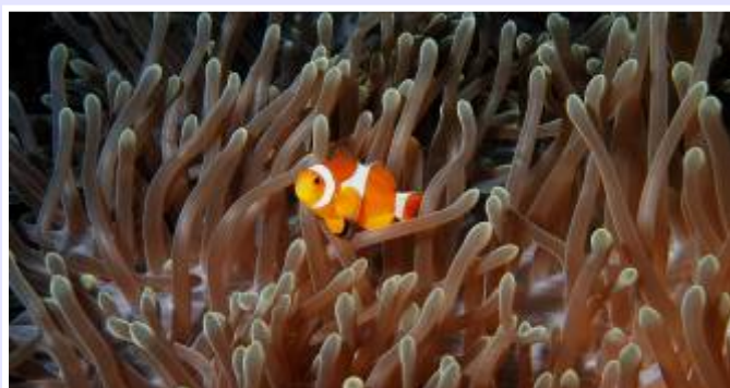
防波堤為人工魚礁

事實上，現在遊艇港範圍內的海床主要由軟沉積物所組成，而遊艇港的防波堤及其他海底結構將能發揮人工魚礁的作用。在香港和其他地方有不少有關海洋生物在人工魚礁繁殖的個案，當中物種包括海藻、甲殼類、雙殼類、軟珊瑚、端足目動物、海葵和可移動動物，如蟹和魚。因此，遊艇港防波堤及其海底結構可為這些物種提供食物和庇護，及吸引其他魚類及海洋無脊椎動物。所以遊艇港發展長遠可令當地區的漁業資源更加豐富。